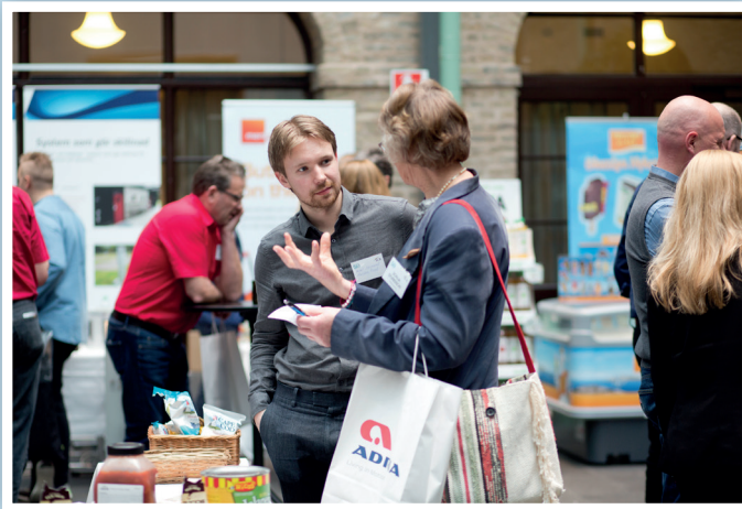
Medverkan på Svensk Campings årskonferens och regionala mässor.