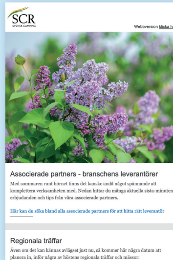
Annonsering i nyhetsbrev.